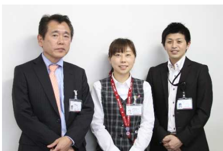
海老名総合病院・座間総合病院