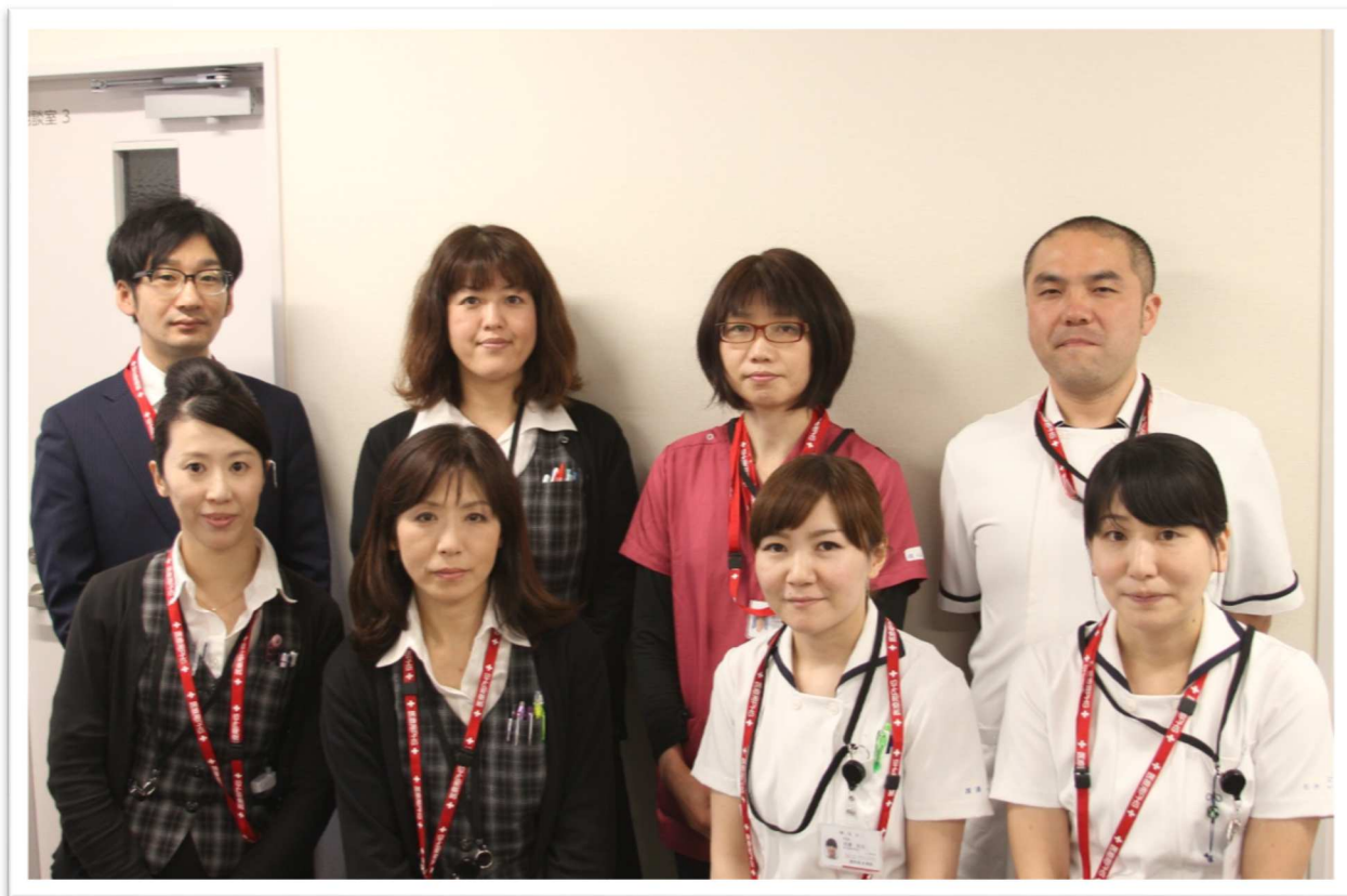
【座間総合病院 地域連携課（事務・MSW）、入退院調整看護師】